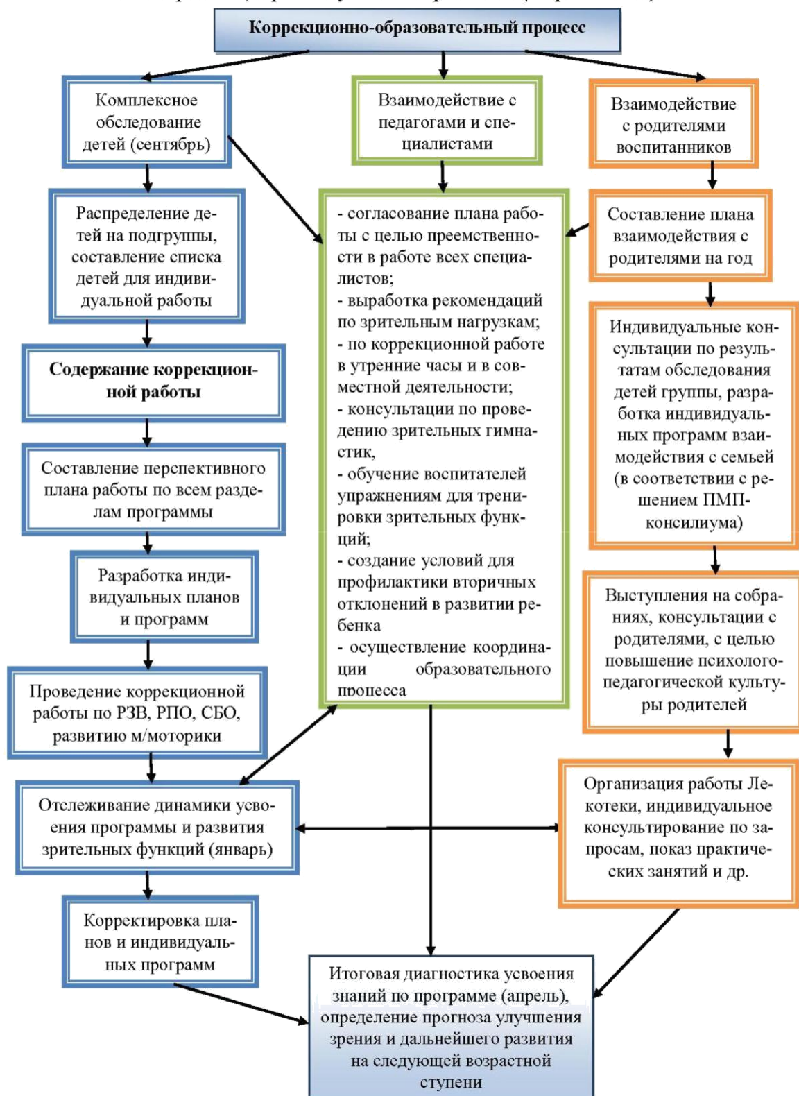
Схема «Организация работы учителя-дефектолога (тифлопедагога)»